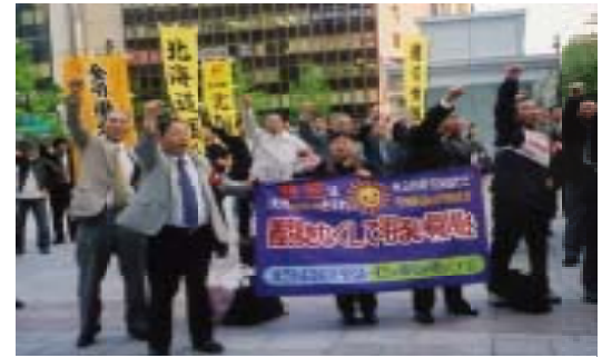
5.25全労連総行動・北海道集会に参加

東芝争議支援共闘会議は、5月25日の北海道を皮切りに6月8日の九州まで、東芝の支社・事業所・工場や関係会社の工場など37箇所と関連する道府県市など25自治体への宣伝と要請行動に取り組みました。