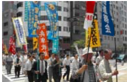
神戸の地域労連昼休みデモに連帯参加

今回の第二次全国行動には、支援共闘会議、全労連と都道府県労働組合組織と傘下の地域労連、電機懇や民主組織、争議団から二百数十名の方々が行動に参加しました。東芝の職場を明るくする